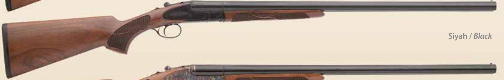
Siyah / Black