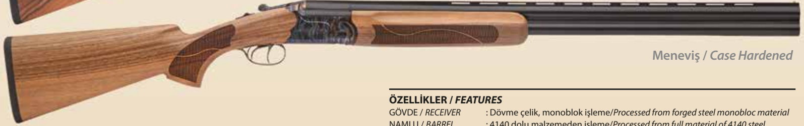
Meneviş / Case Hardened