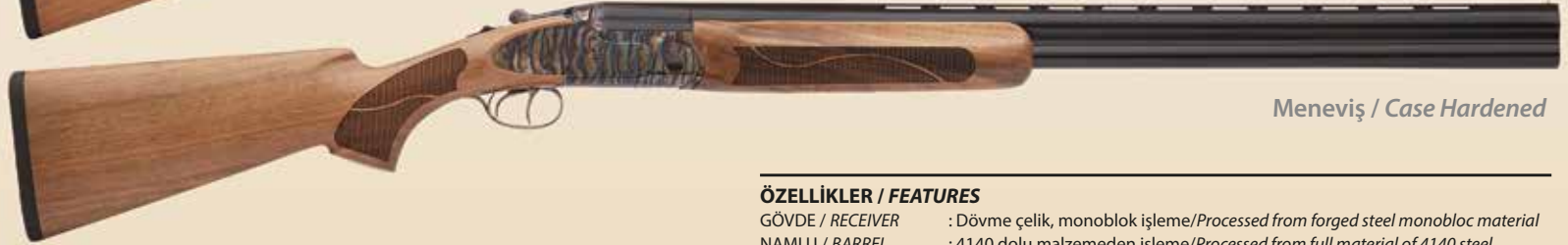
Meneviş / Case Hardened