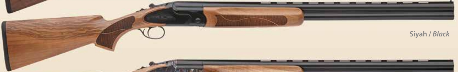
Siyah / Black