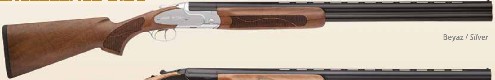
Beyaz / Silver