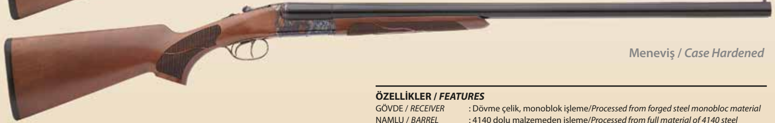
Meneviş / Case Hardened