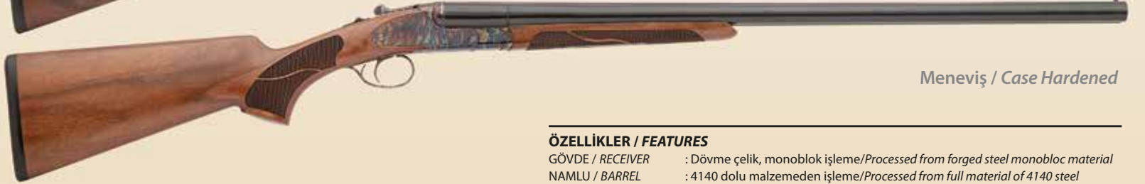
Meneviş / Case Hardened