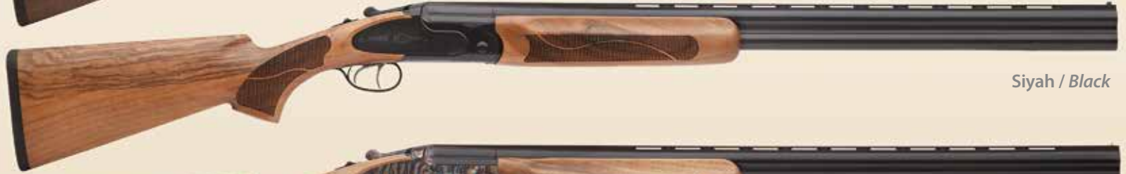
Siyah / Black