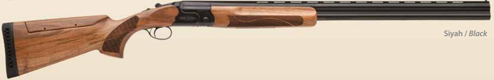
Siyah / Black