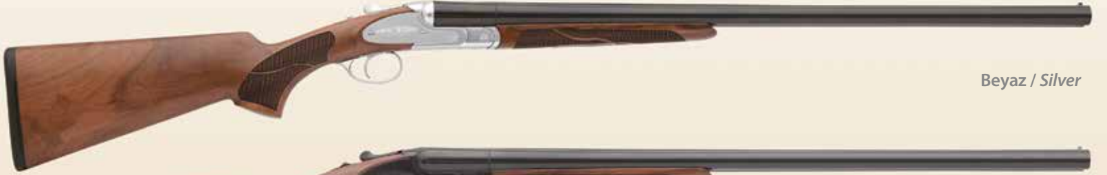
Beyaz / Silver