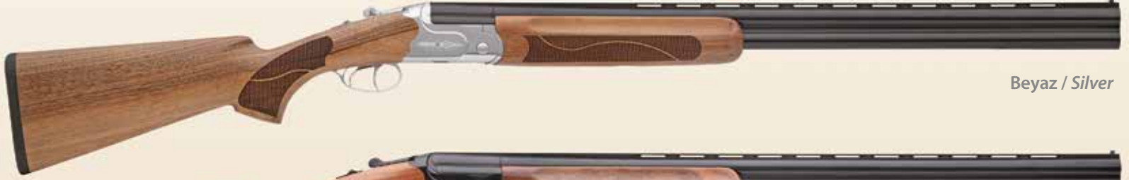
Beyaz / Silver