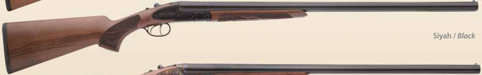
Siyah / Black