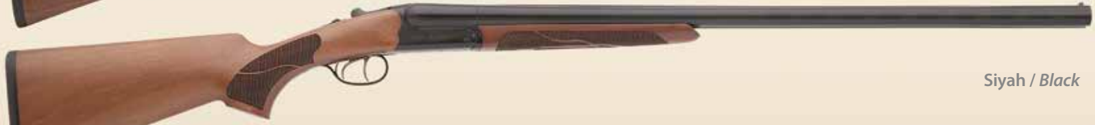
Siyah / Black