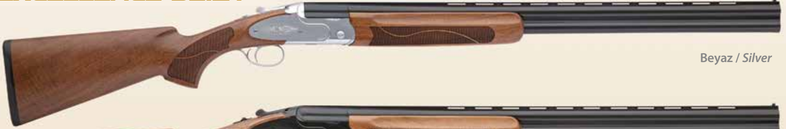
Beyaz / Silver