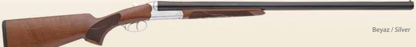
Beyaz / Silver