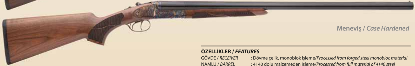
Meneviş / Case Hardened