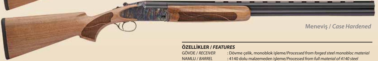
Meneviş / Case Hardened