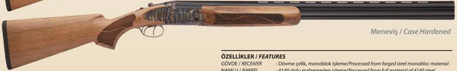
Meneviş / Case Hardened