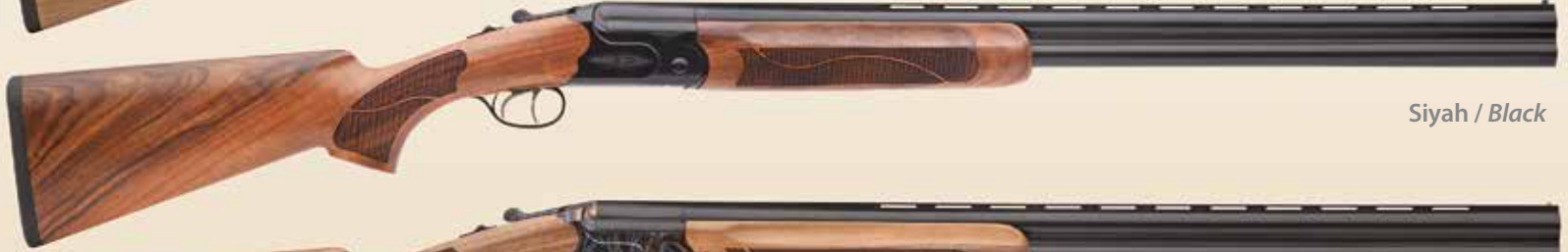
Siyah / Black