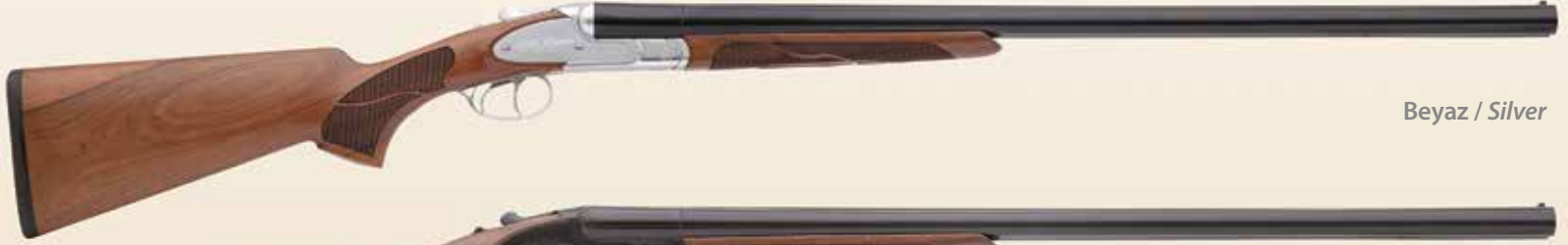
Beyaz / Silver